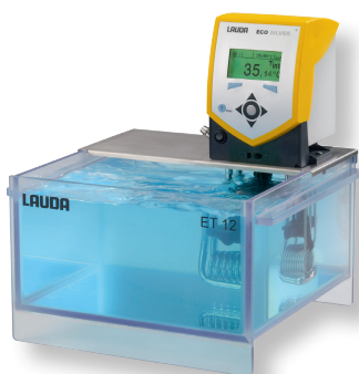
ECO ET 12 S

直接サンプルの観察が可能な透明樹脂製水槽が付属したモデルラインナップです。周囲からの視認性に優れていますので、加熱途中のサンプルの状態や色変化を観察しなければならないような用途目的には最適のモデルです。コントロールヘッドは他のシリーズと同様、シルバー、もしくはゴールドの2機種から選択することができます。水槽の容量は5Lから20Lまでの4種類です。