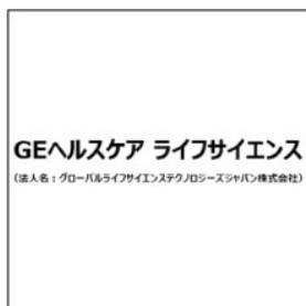
GEヘルスケア ライフサイエンス