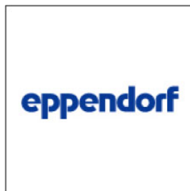
エッペンドルフ(株)