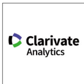
クラリベイト・アナリティクス・ジャパン(株)