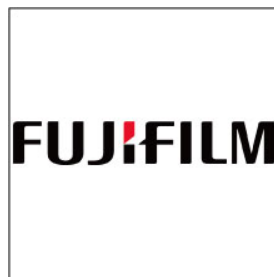
富士フイルム和光純薬(株)