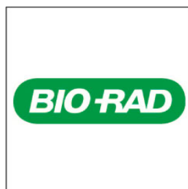
バイオ・ラッド ラボラトリーズ(株)